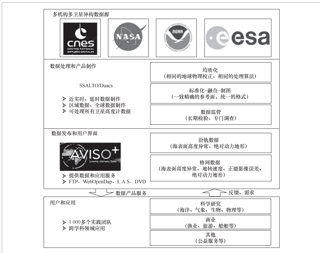
图2 AVISO 数据共享服务应用技术框架