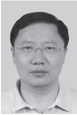
邹自明 (1971- ), 男, 博士, 中国科学院国家空间科学中心研究员、副主任, 主要研究方向为空间科学信息学。