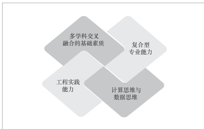
图1 大数据专业人才培养基本目标

大数据技术是与行业应用紧密结合的实践性很强的技术,大数据人才培养中也需要工程实践能力的培养,包括案例教学、实习实训等。